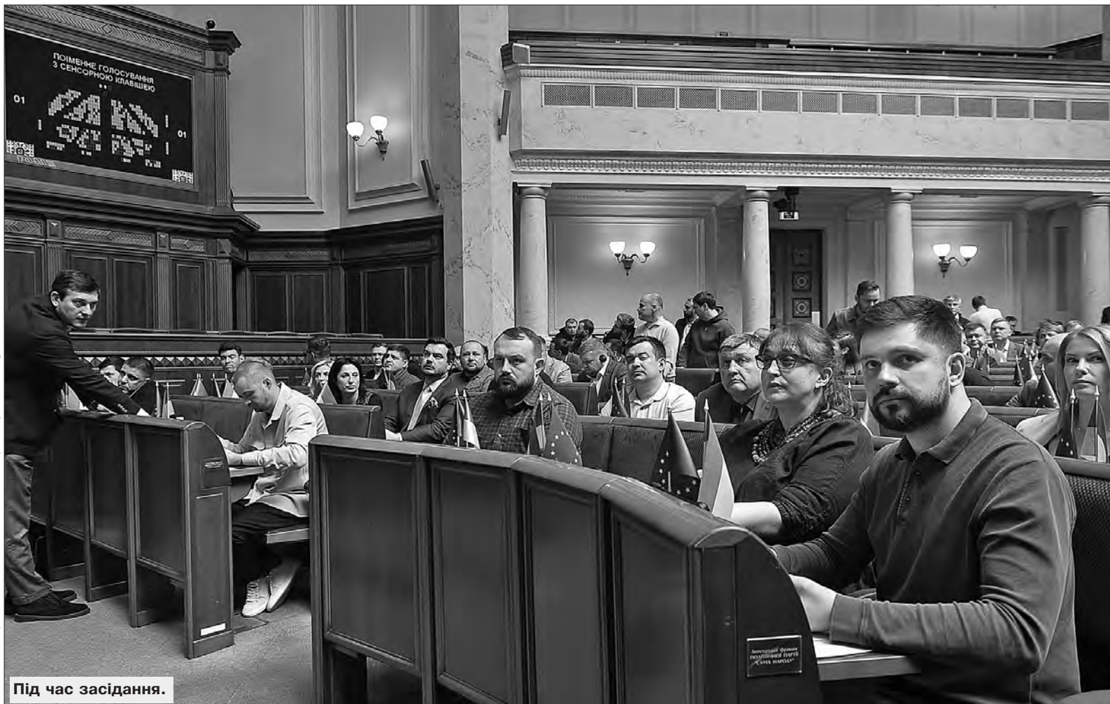
Більше фото тут — www.golos.com.ua