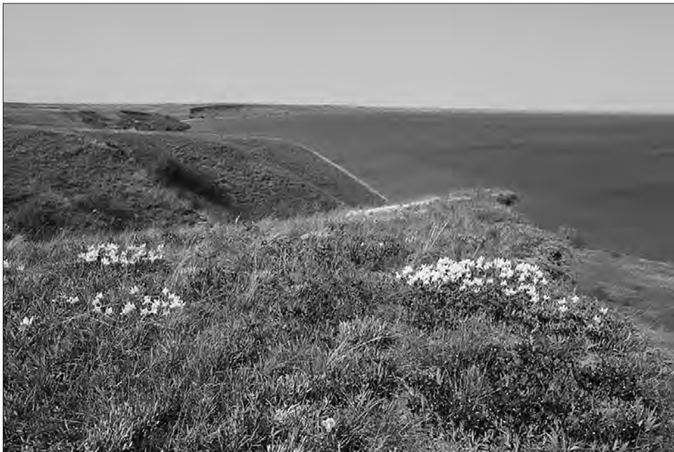
Навесні біля села Каталіне масово квітнуть карликові півники.

Ця збережена в природному стані територія після ухвалення рішення обласною радою відіграватиме важливу роль у планах громади щодо розвитку рекреації, туризму, просторовому плануванні. Крім того, надаватиме понад 30 еко-системних послуг, зберігатиме унікальні флористичні та фауністичні оселища.