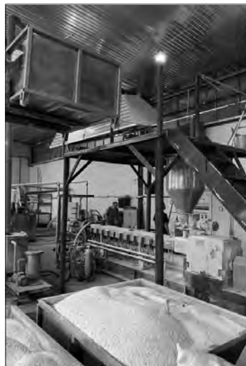
У виробничих цехах компанії «Тана».