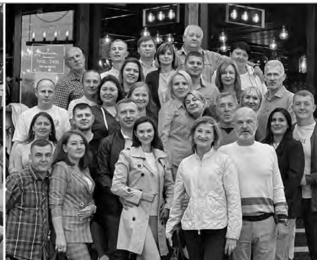
Колектив компанії «Тана».

Підприємство «Тана», що є виробником композиційних полімерних матеріалів, раніше функціонувало в Северодонецьку. Його колектив налічував до 100 співробітників, тут було шість виробничих ліній.